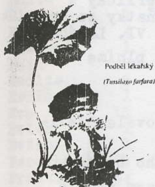
Podběl lékařský (Tussilago farfara)

Čerstvé, mokré listy převázané teplým obkladem přiložené na klouby stížené revmatismem zmírňují bolesti a odstraňují otoky.