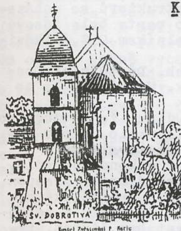
Kostel Dobrotivá P. Marie