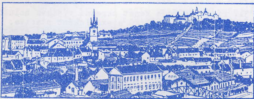
POHLED NA PŘÍBRAM SE SVATOU HOROU

V sobotu 2.října byly znovu otevřeny po generální rekonstrukci památkově cenné barokní kryté schody, které v sedmdesátých letech zčásti shořely.