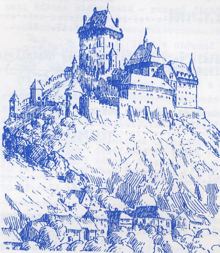
Karlštejn. Nakreslil Frant. Schmidt