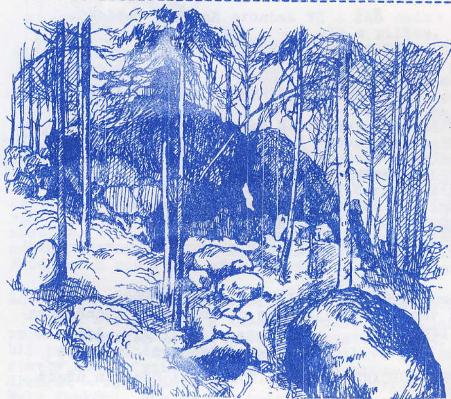
»Fabiánova postel« na Babě

tahy dováželo dřevěné uhlí do komárovských, čenkovských a strašických hutí.